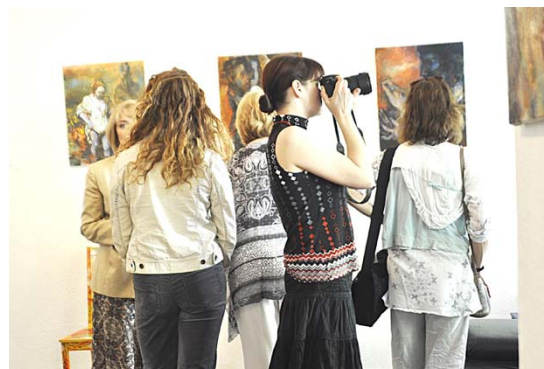
Eindrücke von der Vernissage am 20. Mai