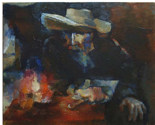
Michail Schnittmann, „Kerzenlicht“ 80x65, 2011